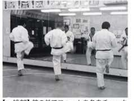
【塾正面】ガラス張りの道場で安心・「無料体験入塾」有り! 【少年部】軽防具をつけての乱取り練習 【一般部】鏡の前でフォームを各自チェック

〒641-0031 和歌山市西小二里 2-4-82 和歌浦観光企画ビル 1F(大浦街道「ガスト」北隣) 【練習日時】月・水・金曜日 (PM6:30~9:30) 見学歓迎! さわやか青少年育成道場 ニッケンスクール高典塾